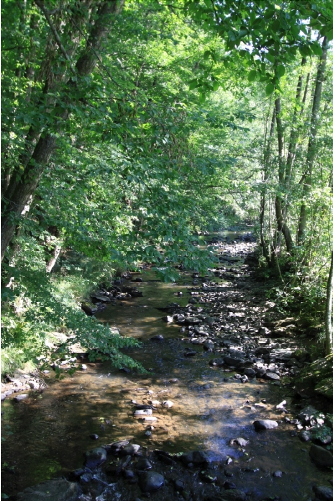
Kleine Nister bei Limbach