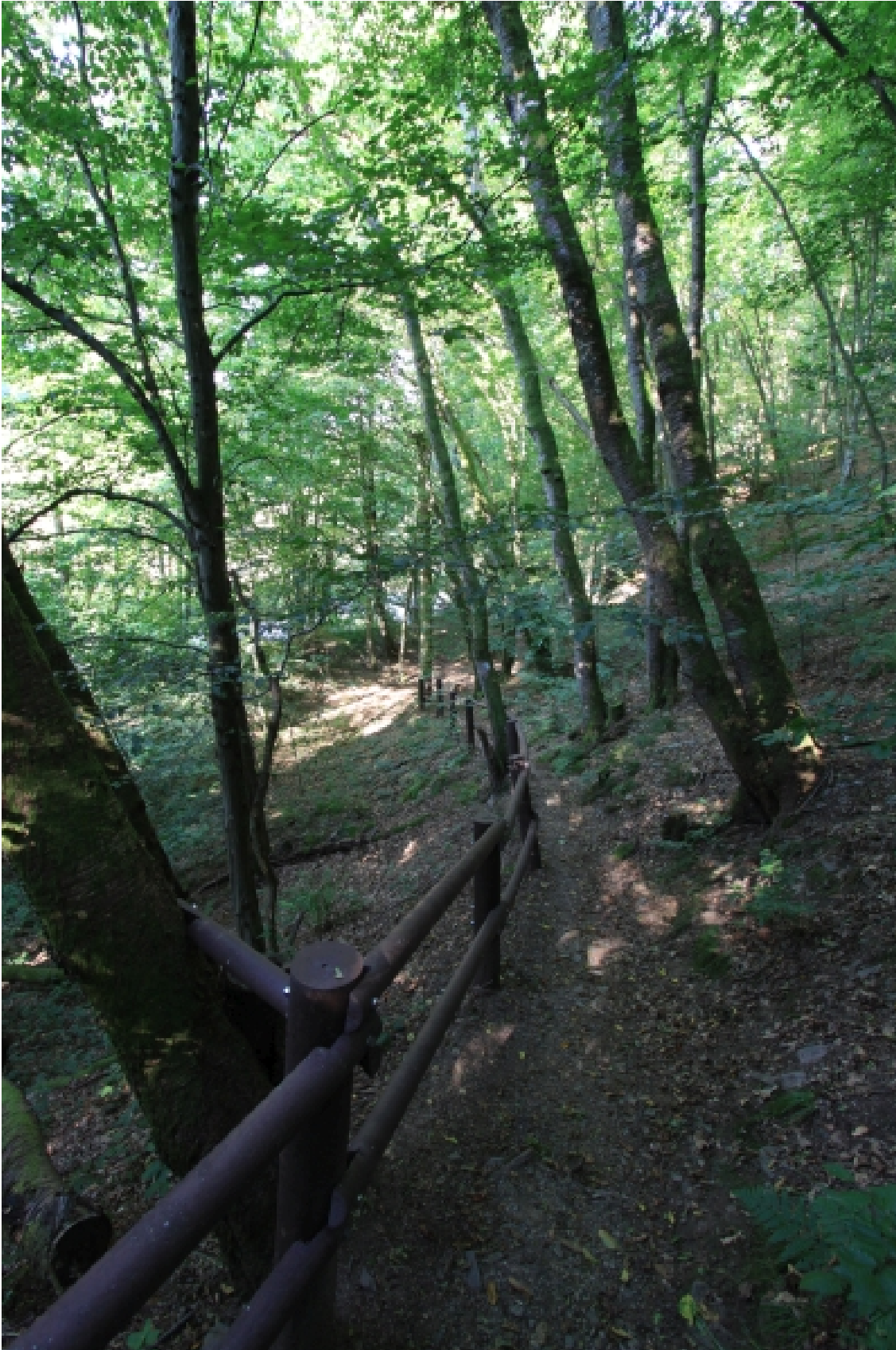
Abstieg zum Bachlehrpfad