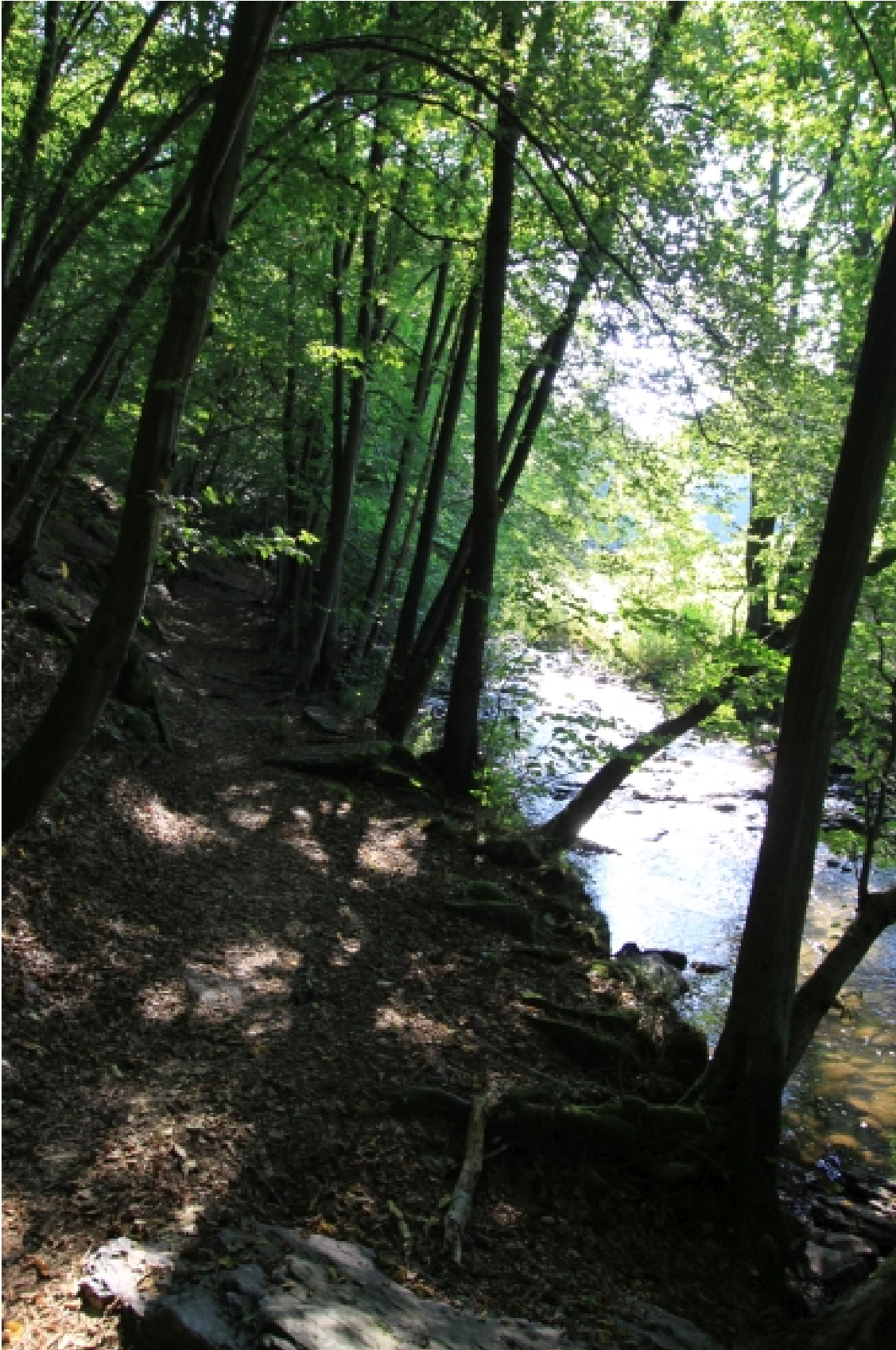
Kleine Nister bei Limbach