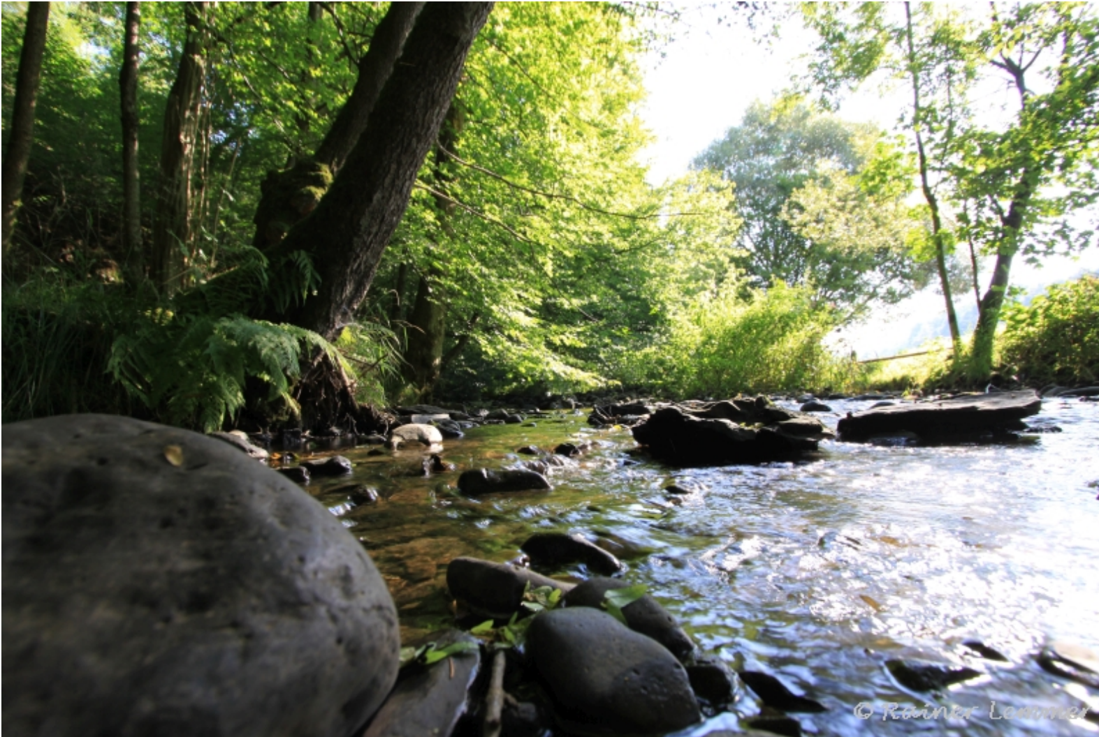
Kleine Nister bei Limbach