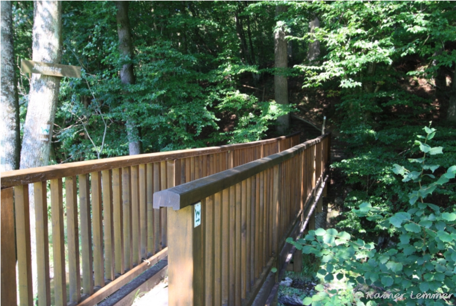
Nisterbrücke bei Limbach