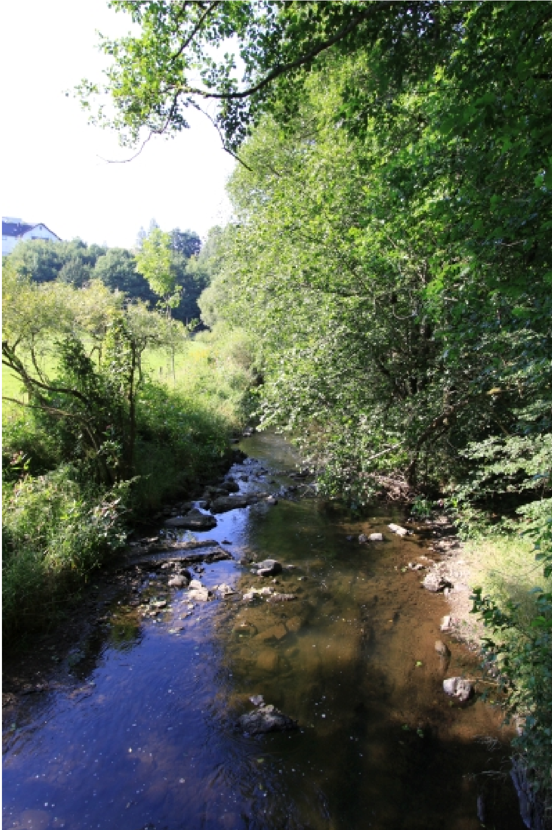
Kleine Nister bei Limbach