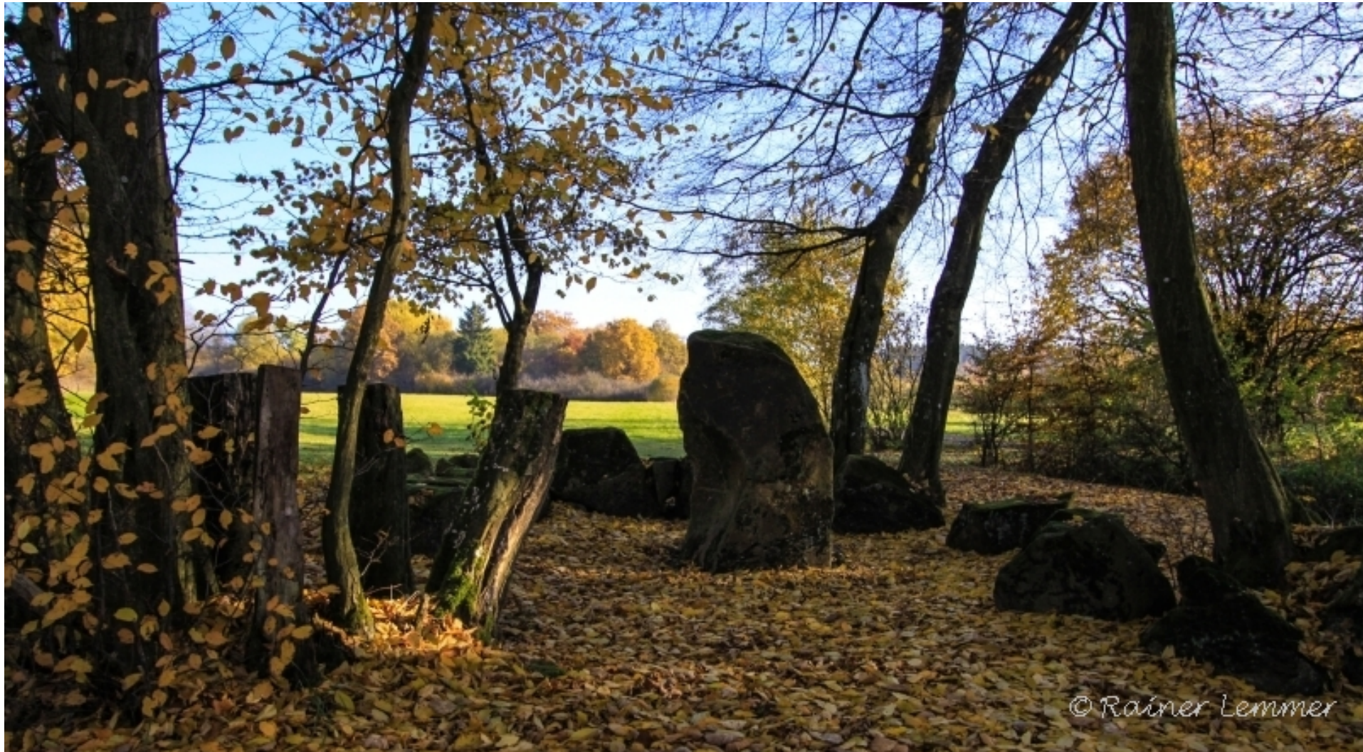
Keltische Kultstätte ?