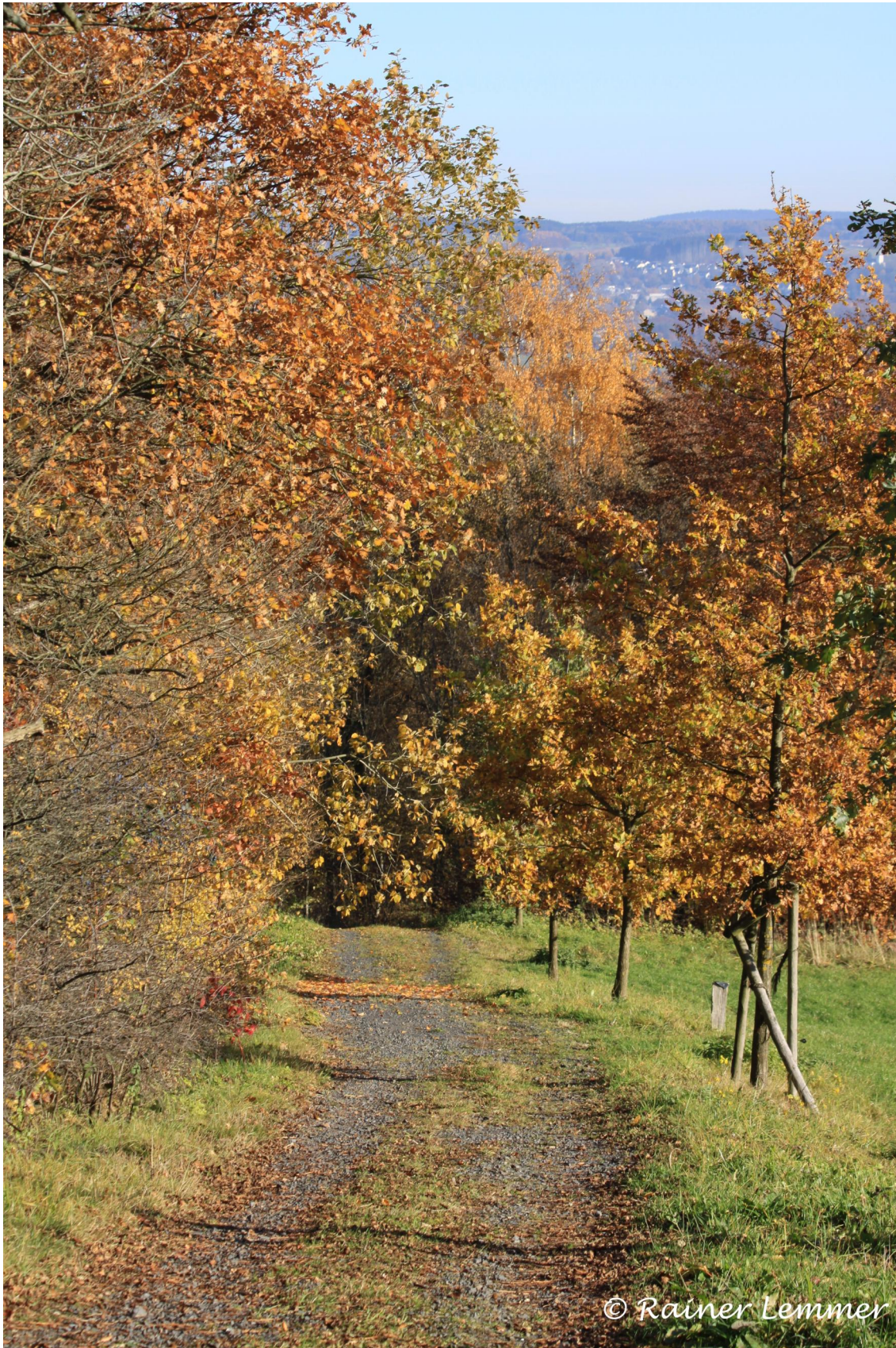
Schöne Wege um Stockum-Püschchen